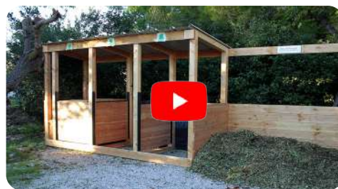
Exemple d'accompagnement de projets par Compostons, au Mas des Moulins (Montpellier)

Visite mensuelle d'un Maître Composteur jusqu'à la première récolte de compost (6 mois) pour mettre en confiance et assurer les bonnes pratiques.